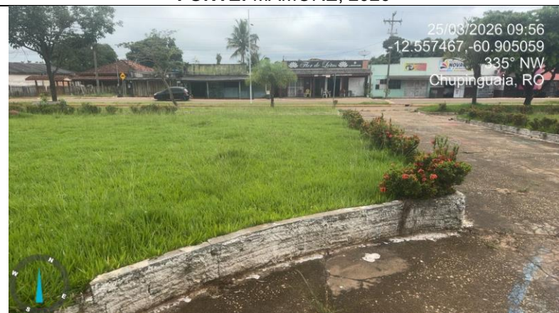
IMAGEM 02: LOCAL 01 – PRAÇA DA MATRIZ