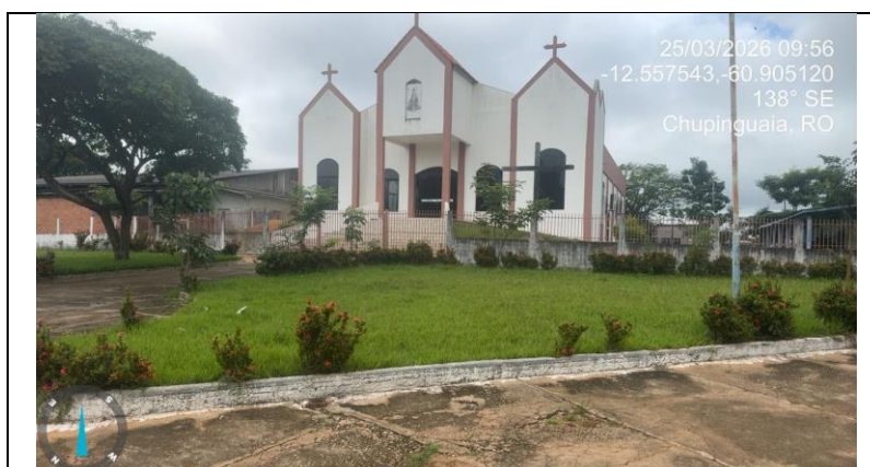
IMAGEM 01: LOCAL 01 – PRAÇA DA MATRIZ

COORDENADAS - 12°33'26.26"S, 60°54'15.85"O